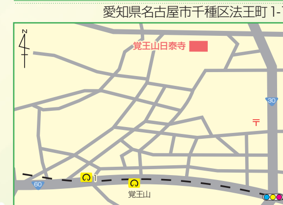
○名古屋大学地下鉄 東山線「覚王山」駅下車 1番出口から徒歩約10分 ※会場には駐車場がありませんので公共交通機関でお越しください