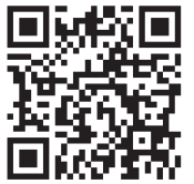
あいち・なごや強靱化共創センター