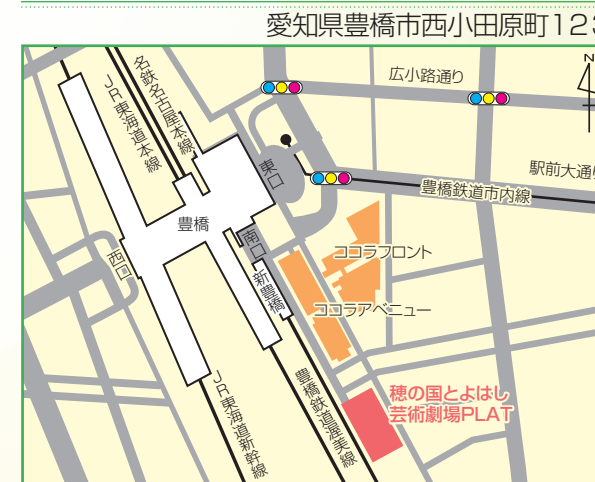
○JR東海道新幹線、東海道本線、名鉄名古屋本線「豊橋」駅下車 南口から徒歩約3分 ○豊橋鉄道渥美線「新豊橋」駅下車 徒歩約3分