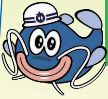
あいち防災キャラクター 防災ナマズン