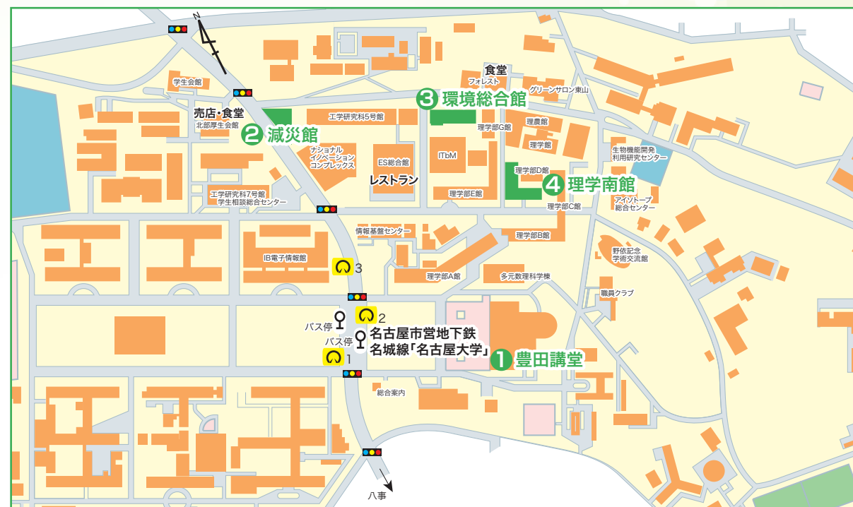
○名古屋大学地下鉄 名城線「名古屋大学」駅下車 2番出口から徒歩約5~10分 ※会場には駐車場がありませんので公共交通機関でお越しください

① 豊田講堂 ホール・シンポジオン ② 減災館 ③ 環境総合館 レクチャーホール ④ 理学南館 坂田・平田ホール