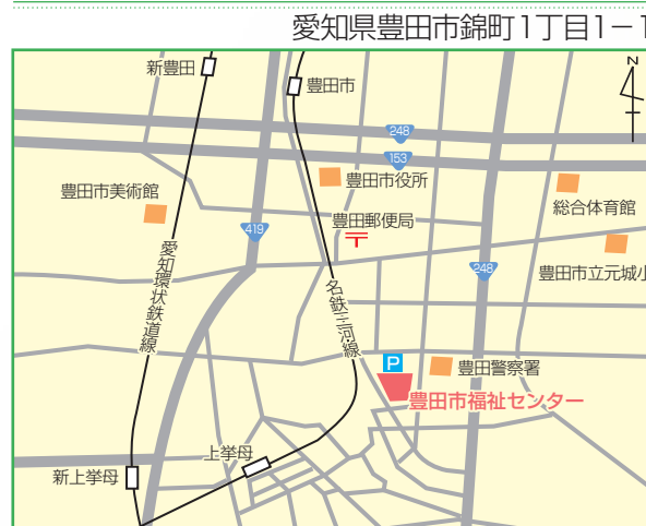
○名鉄三河線「豊田市」駅から徒歩約30分、「上學母」駅から徒歩約10分 ○愛知環状鉄道「新豊田」駅から徒歩約35分、「新上學母」駅から徒歩約15分