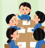
防災マニュアルの作成