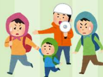
町内会や職場の防災訓練の企画