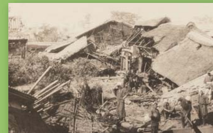
書籍:ジョン・ミルン他著, The Great Earthquake of Japan, 1891より

今年は、宝永地震(1707)から310年を迎えます。奇しくも同じ10月28日に発生した宝永地震(1707)と濃尾地震(1891)を取り上げ、東海地方の歴史災害をとおして、現在の我々が防災・減災について考える新たな視点を紹介します。