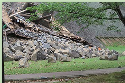
平成28年震災直後の熊本城

本企画展では、熊本地震から1年を迎え、昨年度の速報展示後に行った取り組みも踏まえて、名古屋大学減災連携研究センターの調査・研究結果をご紹介します。今一度、一人一人が日ごろからの地震対策を振り返る機会にして頂ければと思います。