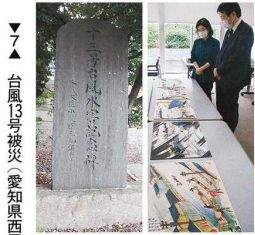
台風13号の被災状況を描いた水彩画。愛知県西尾市岩瀬町の西尾市岩瀬文庫で。復旧事業完了を記念した碑。同市一色町飯田新田の飯田神社境内で。