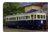
丸窓電車モハ 5251

昭和 61(1986) 年までは、別所線のシンボルでもある丸窓電車モハ 5250 形が運行していました。モハ 5250 形をかたどった「まるまどくん」を始めとした新旧車両をデザイン化したシンボルマスコットが、路線を盛り上げています。