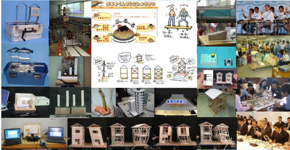
131014 南海トラフ広域地震防災P・地域連携減災研究 名古屋大学減災連携研究C 福和伸夫